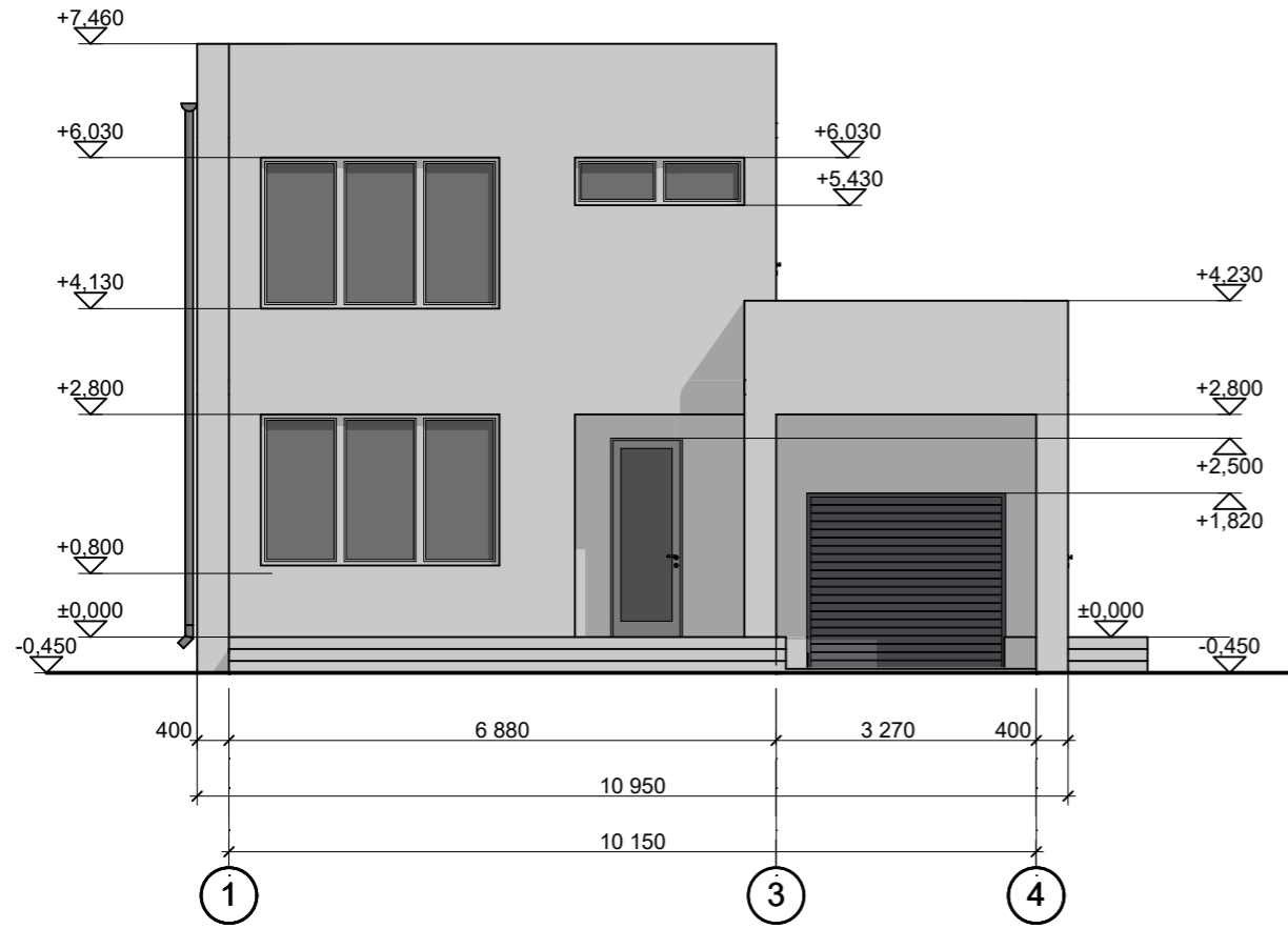
Фасад в осях 1 - 4