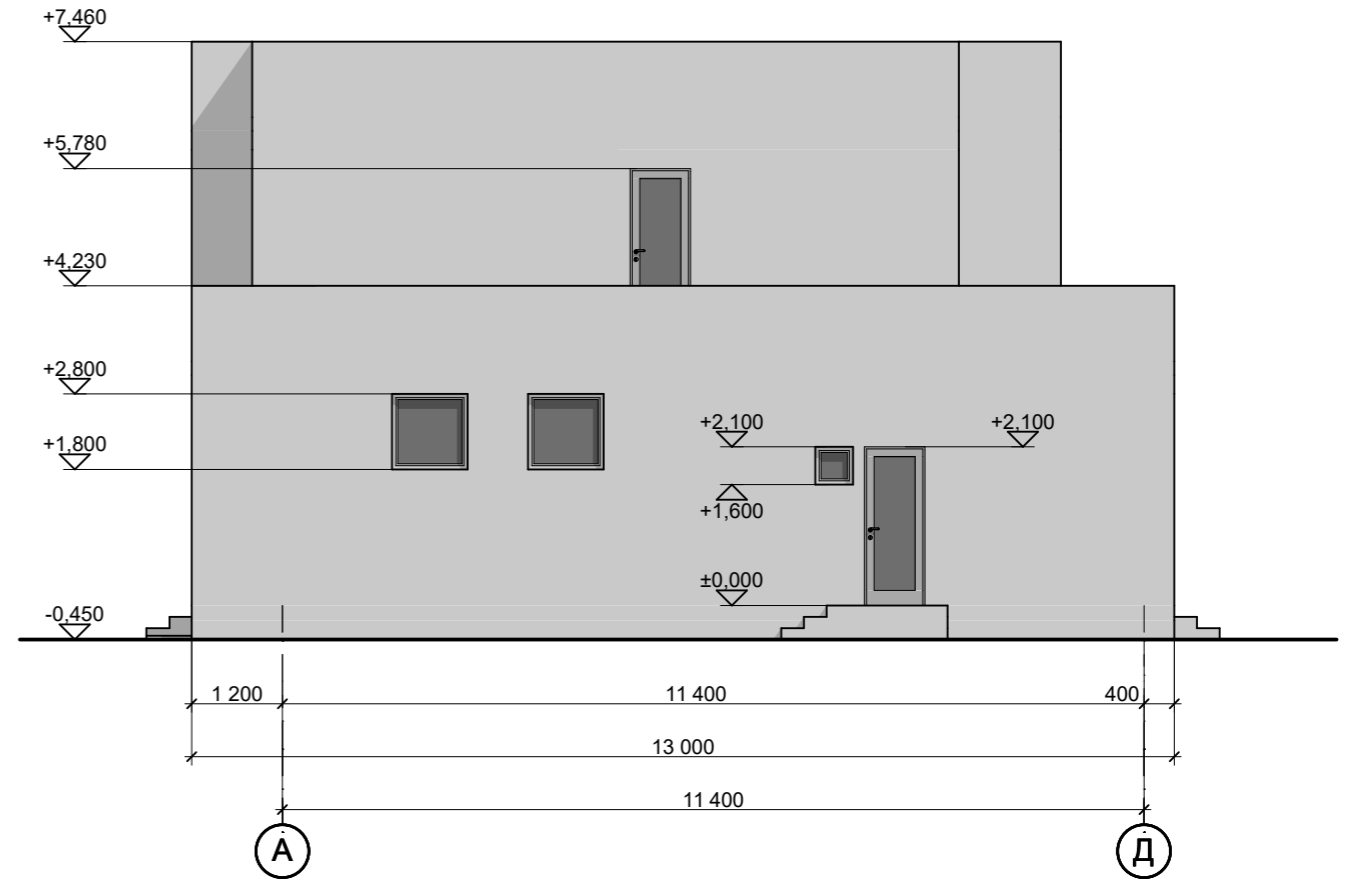
Фасад в осях А - Д